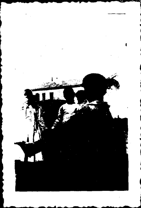
ילדי פונה ב' כוקד ים הוקרה