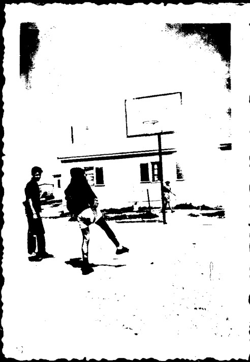
הנה אלי - בויט בפזור לעבר עמדם .