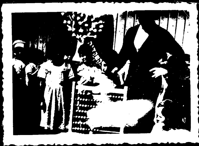
מי חכם גידף לענות !! ?