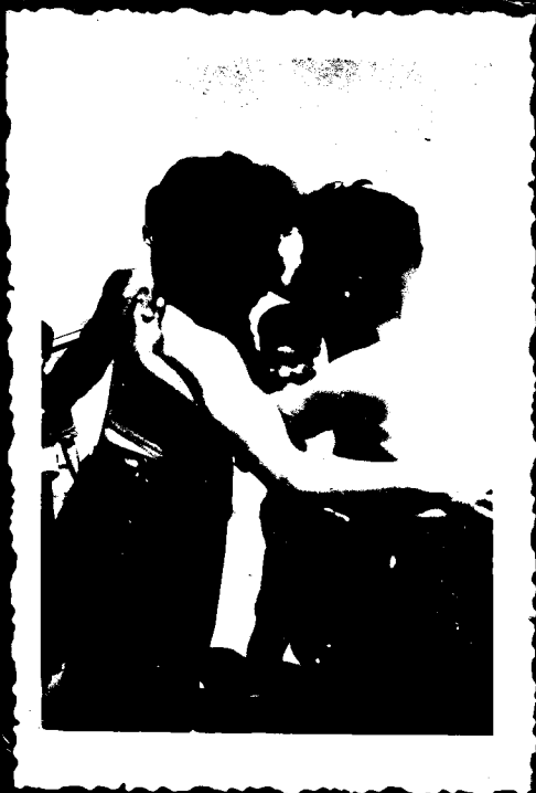
חידה - היעקב ינצה בהתלבקות או מישראל ?