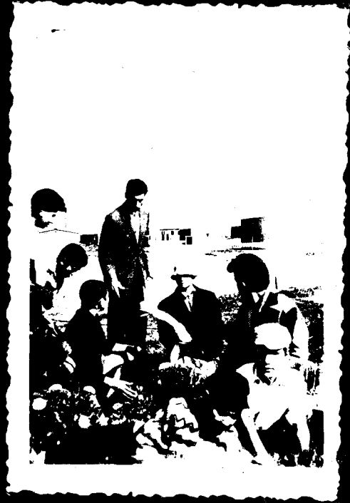
פרחי ישראל עם פרחי הגנה