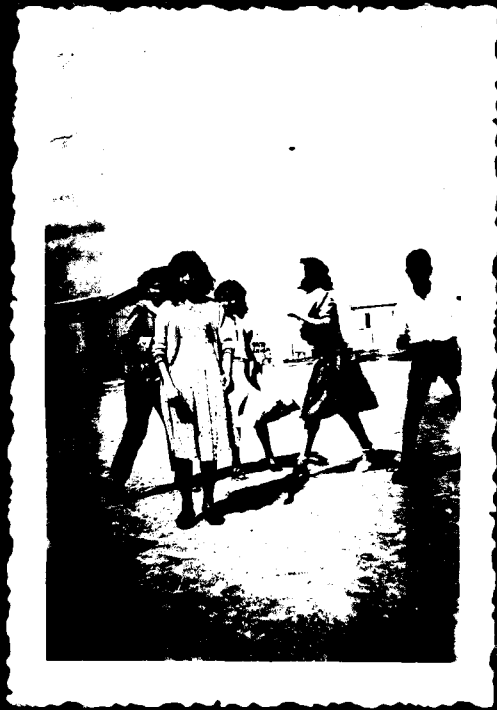
הפסקה ! קודקודיהם מבהיקים בשמש האביב .