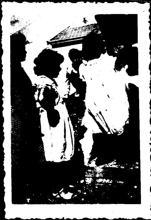
הקדמית רפואה למכה אמון כניסה למקלט