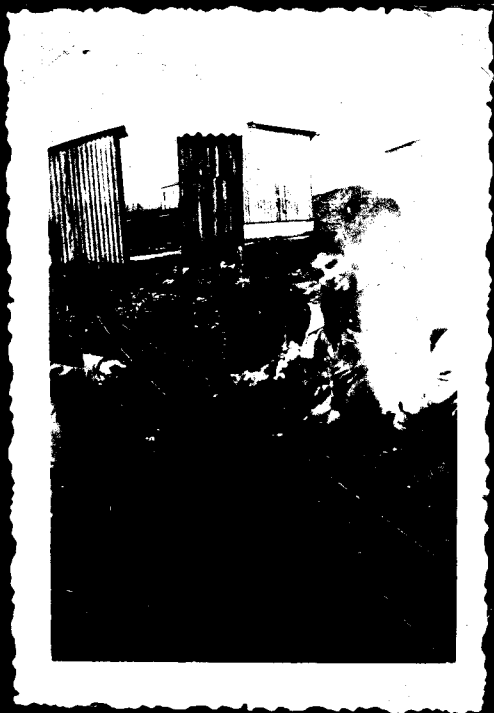
בודאי גנתנו היפה תהן לנו פרי הלולים .