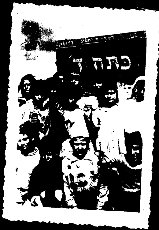
ביום א' ראשית ב' בתמונה תורה היא חיינו