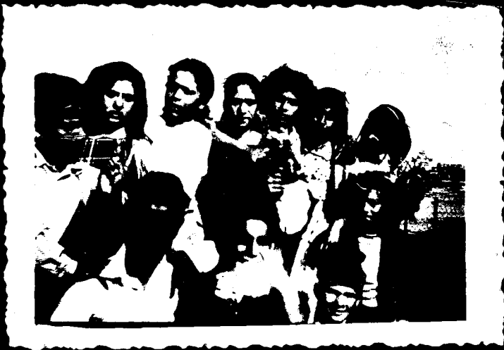
אגודת הבריאות הליכון מקור כל פגז